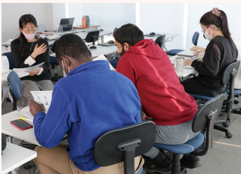
仲間と協力しながらN1・N2の合格をめざす講座