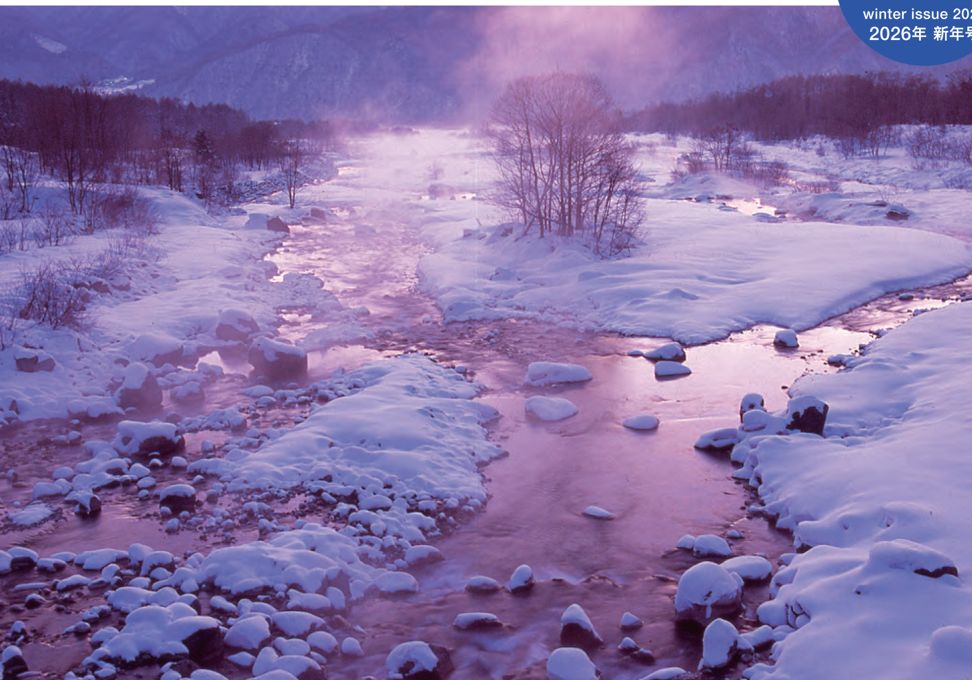
「白馬 姫川(長野県)」