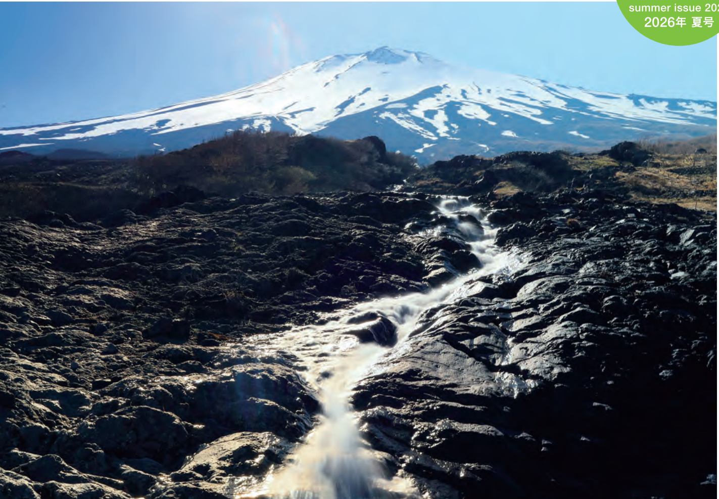
「まぼろしの滝(富士山須走五合目)」